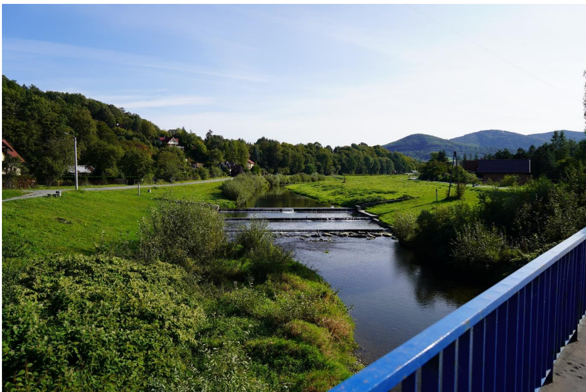
Zdjęcie 3 Rzeka Brenica, widok z mostu na ul. Zofii Kossak w Górkach Wielkich

W wyniku powodzi jakie miały miejsce w latach ubiegłych (szczególnie 2010 r.), a także w wyniku erozji wodnej w obrębie koryta Brennicy (a także pozostałych cieków) powstały szkody mające wpływ na bezpieczeństwo osób i są to m.in. zerwane progi i stopnie wodne, wyrwy brzegowe oraz w dnie koryta.