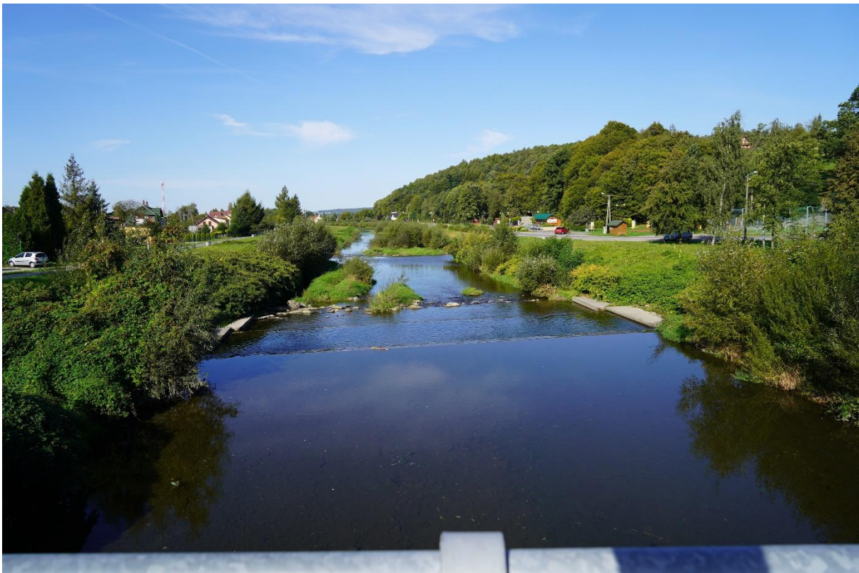
Zdjęcie 1 Rzeka Brennica, widok z mostu na ul. Bielskiej

Z uwagi na charakterystykę wymienionych powyżej rzek i potoków nie stanowią one odpowiednich miejsc umożliwiających organizację kąpielisk ani miejsc okazjonalnie wykorzystywanych do kąpieli.