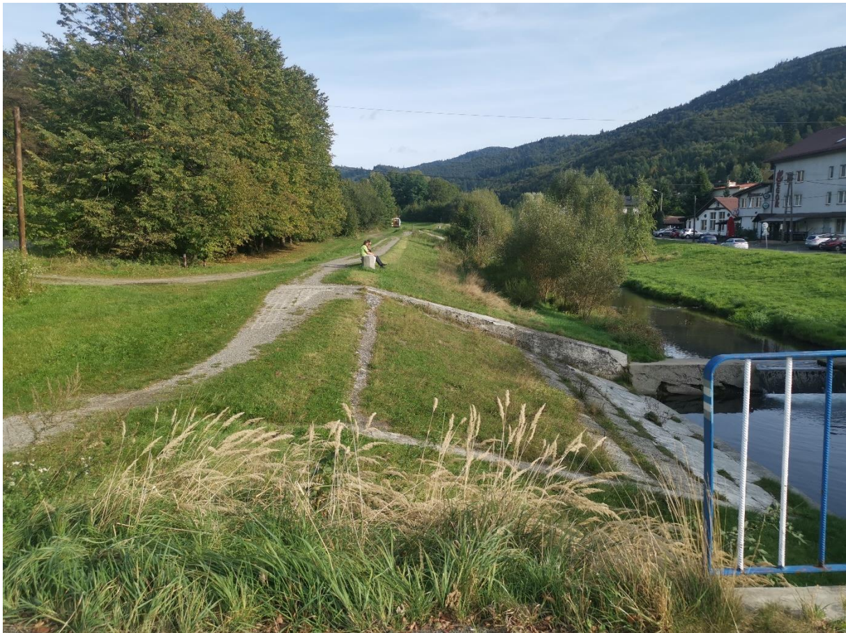
Zdjęcie 2 Rzeka Brenica, widok z mostu na ul. Hołcyna

Niemniej jednak, co roku w okresie letnim na terenie miejscowości Brenna oraz Górki Wielkie można stwierdzić występowanie licznych miejsc wykorzystywanych do plażowania lub kąpeli przez mieszkańców i turystów. Szczególnie miejsca te występują nad brzegami rzeki Brennica (sporadycznie rz. Wisła, p. Hołcyna, p. Leśnica). Są to miejsca atrakcyjne przyrodniczo i krajobrazowo jednak ze względu na charakterystykę nie nadają się one do bezpiecznego wykorzystywania jako kąpieliska czy miejsca wykorzystywane do kąpeli.